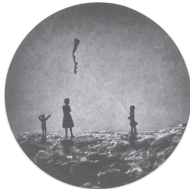
Día de viento Autor: José López Giménez 1er Premio Internacional del XLIX Concurso Internacional de Fotografía

50 ANIVERSARIO CONCURSO INTERNACIONAL DE FOTOGRAFÍA MONÓVAR FIESTAS DE SEPTIEMBRE 2018